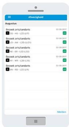
1 Kies Afwezigheid Klik op Melden