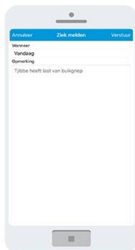
2 Selecteer de Datum Voer Opmerking in